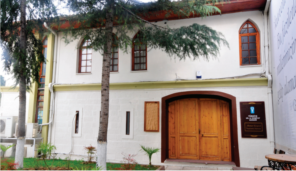
Ahmet Yesevî Hizmet Binası