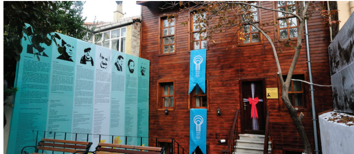
Sezai Karakoç Hizmet Binası