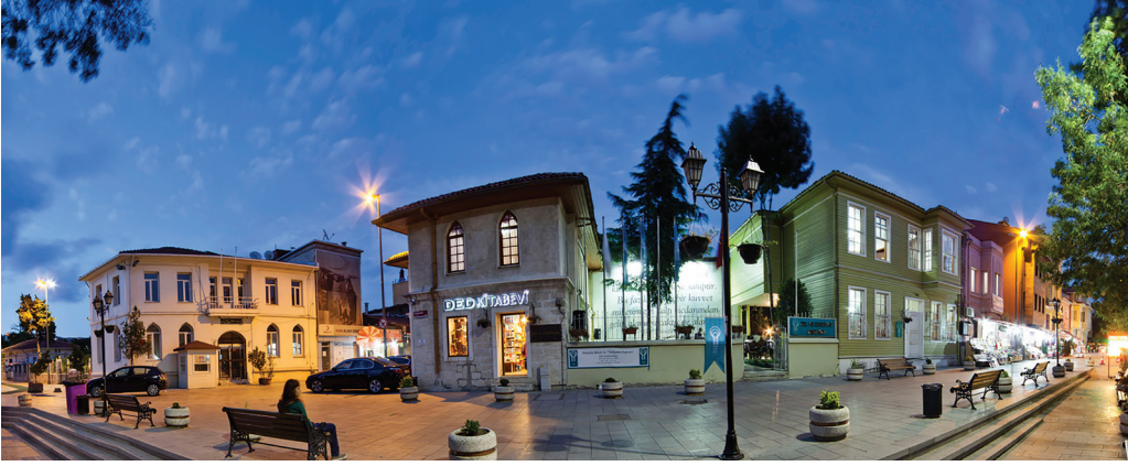
Türkiye Dil ve Edebiyat Derneği Genel Merkezi Hizmet Binası